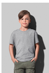
ST2220 Classic-T Organic